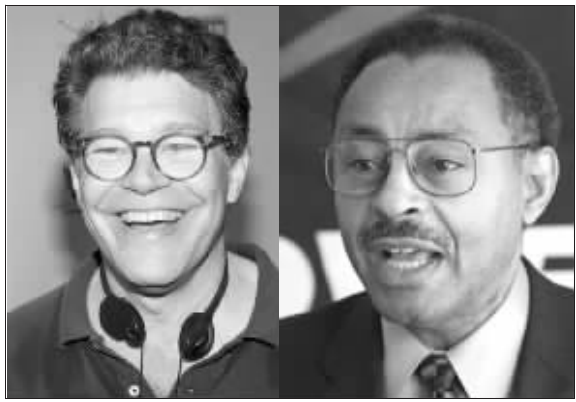
罗兰·伯里斯(右)和阿尔·弗兰肯(左)

布拉戈耶维奇的发言人5日说,指定伯里斯补缺空位的文件已递交至参议院,但未获对方正式接受。这份文件同样缺少伊利州州务卿杰西·怀特的签名认可。伯里斯已要求伊利州最高法院强制怀特签署这一文件。