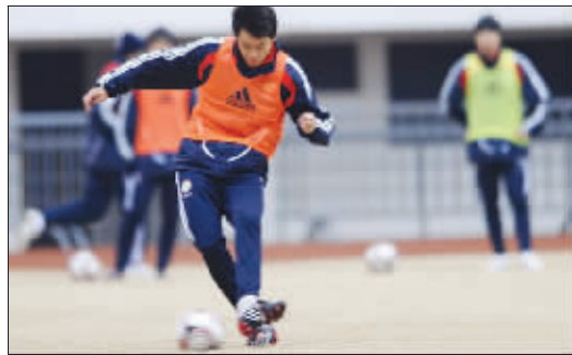
昨天,国足在上海进行出征前的最后一练。昨晚,国足从上海浦东机场出发,开始西亚之旅。1月14日,国足的第一场亚洲杯预选赛将打响,对手是叙利亚。

赛,并且从上周末开始。上周末是西丙联赛洛哈省的第19轮,罗格洛涅斯客场挑战阿内多,结果在比赛开始时,主裁判发现罗格洛涅斯仅有9人到场,没办法,比赛就以9对11开球,比赛中先后又有8名罗格洛涅斯球员申请红牌离场,结果在仅开球30分钟后,裁判就结束了比赛,最终比分为阿内多1:0取胜。(王文)