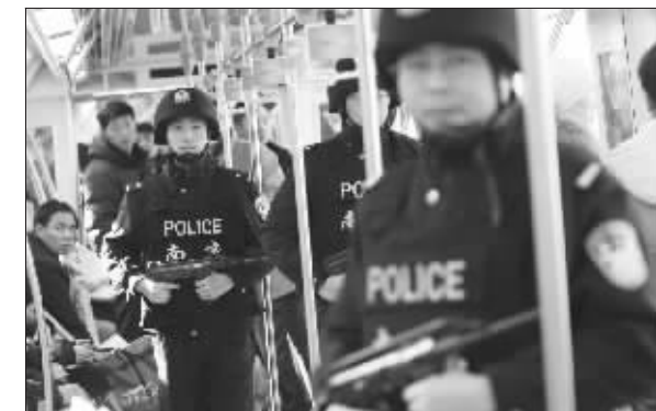
昨天，南京白下公安分局的特巡警正在地铁武装巡逻。为保证元旦期间辖区内商业区的安保工作，白下公安分局共出动了300余名民警和400余名保安，全力做好治安巡逻、反扒和疏导人流的工作。

法院审理后认为，当工伤事故与第三人侵权发生竞合，受害职工可以分别适用不同的法律获得应有的救济。张雁等4人虽在民事侵权一案中得到了赔偿，但仍然可以依据《工伤保险条例》的规定享受工伤保险待遇。因此，从保护弱势主体的角度出发，一审判决陈骏所在公司支付张雁等4人丧葬费、一次性死亡补助金等近12万元，并自2007年4月起，每月支付死者的父母各604元。日前，南京中院终审维持了这一判决。(文中人物为化名)