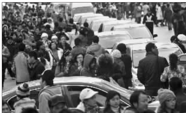
南京新街口商业区人流车潮异常拥挤

昨天是元旦假期的第二天，南京各百货商场是几家欢喜几家愁。由于金鹰旗下金鹰购物中心、东方商城、金鹰天地三家进行联合促销，新年第一场商战实际上成为两家百货巨头——金鹰系和中商系之间的厮杀，而小型百货则继续“一声叹息”，生意和客流仍旧不见起色。