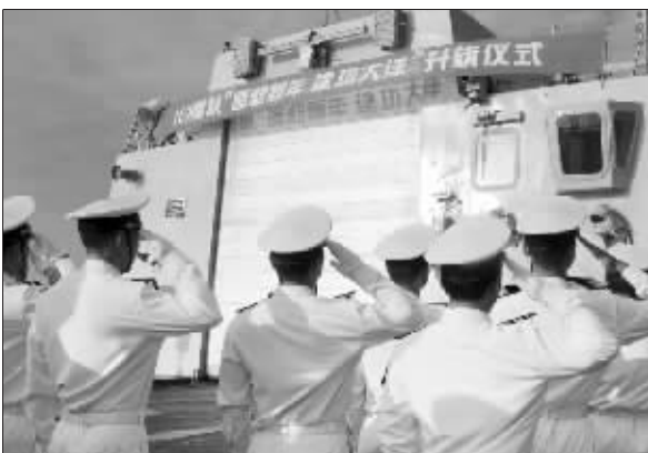
2009年的第一天，中国海军赴亚丁湾、索马里护航编队官兵举行“喜迎新年、建功大洋”升旗仪式