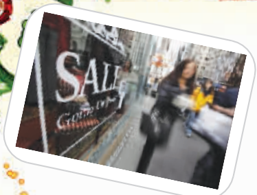
美国商家门外的打折广告