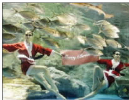
韩国美女水下贺圣诞