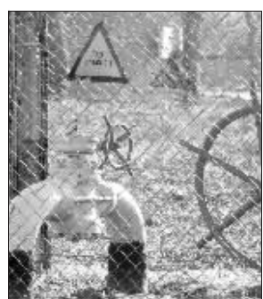
位于乌克兰的天然气管道压力阀

由于欧洲四分之一的天然气需求由俄罗斯满足,加之俄输往欧洲的天然气80%途经乌克兰,许多欧洲国家密切关注