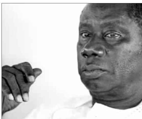
刚刚病逝的几内亚总统兰萨纳·孔戴

几内亚政府官员23日宣布,几内亚总统兰萨纳·孔戴22日晚在首都科纳克里的医院因病去世,终年74岁。