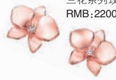
兰花系列玫瑰金镶钻耳环 RMB:22000