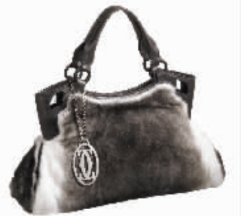
小型灰色兔毛手袋 RMB:19400