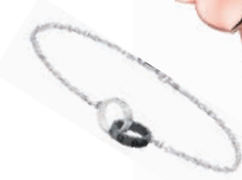
Baby 白金钻石黑陶瓷手链 RMB:9600

珠宝是理想的圣诞礼品——闪烁的光芒媲美璀璨的星光;而宝石永恒不变的质量更印证恋人忠贞的爱情,温馨难忘的节日时刻。用卡地亚精致珠宝向爱人表达宠爱一生的承诺,让两颗心在卡地亚的魔法下慢慢溶化成缠绵的爱意。