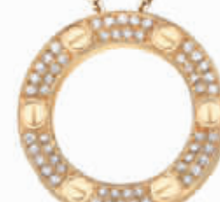
黄金密镶钻石项链 RMB:51000