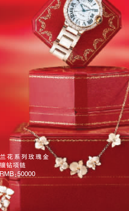
兰花系列玫瑰金镶钻项链 RMB:50000