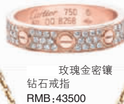
玫瑰金密镶钻石戒指 RMB:43500