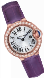
Ballon Bleu 小型号玫瑰金镶钻腕表 RMB:157000