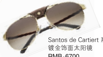
Santos de Cartier 系列镀金饰面太阳镜 RMB:6700