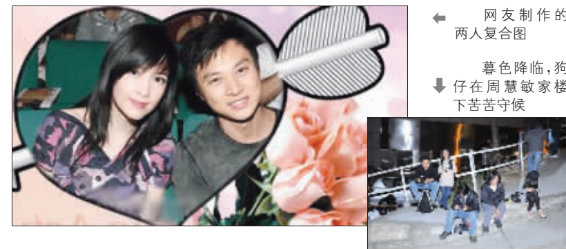
网友制作的两人复合图