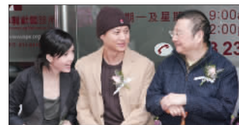
倪匡的调侃令二人复合?

人分手声明发出之后,一向对人嘻嘻哈哈的老顽童倪匡大发脾气。因此忽然结婚很有可能是倪匡出面干预,逼倪震浪子回头。