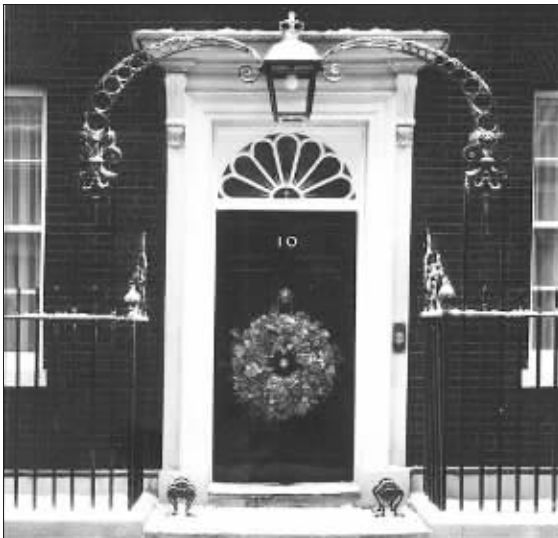
这是英国首相布朗今年发布的圣诞卡,图中的“雪”完全是假的

据英国《每日邮报》12月16日报道,英国首相布朗及其前任布莱尔都对他们今年的圣诞贺卡做了“加工”:一个采用了“人工制雪”,另一个则对其牙齿进行了增白。