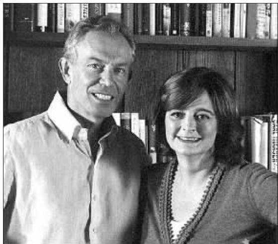
布莱尔夫妇这张照片会不会让人误以为是某个牙膏的广告宣传图呢