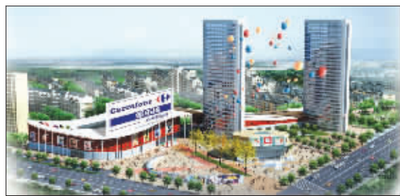
家乐福进驻大华·锦绣华城

家乐福第5家店新店址最终敲定,它落户江北新城的大华·锦绣华城,一座体量达21000平方米的大华家乐福大卖场将在滨江北岸崛起。由于该店体量超前,同时又以物美价廉著称,江北居民有望告别跨江时代,就地解决购物需求。而在拥有这个超级配套后,大华·锦绣华城也成为南京楼市少有的最强配套社区,该项目的“家乐福时代”也正式来临。