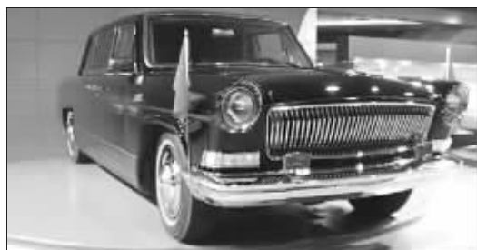
1999年阅兵时,江泽民乘坐的阅兵车型