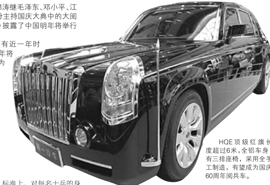
HQE顶级红旗长度超过6米,全铝车身,有三排座椅,采用全手工制作,有望成为国庆60周年阅兵车。

正规军队的选拔也在进行中。“在全军范围内,对受阅部队的选拔工作已经接近尾声,正在加紧最后的调整充实。”台北“中央社”在12月10日的报道中这样说,“选拔