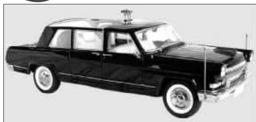
1984年阅兵时,邓小平乘坐的阅兵车型