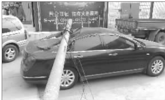
幸好当时车里没人

“我的车子刚停下来不到5分钟,就被旁边的电线杆倒下来砸得不像样子了。最可气的是,事故出现后这根电线杆的主人却找不到了。”