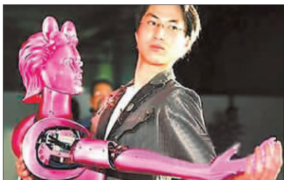
3年前,日本就研制出了能和人类共舞的机器人