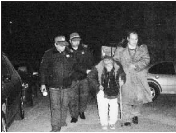
民警,保安和门卫一起送老人回家

迷路的老人坐在路边发呆,市民和民警热心相助,但在凌晨1点左右众人将老人家送回家中时,老人的儿子先是对老人怒道:“你干什么的,别人不要睡觉啊,几点钟了?”接着转身对着众人大骂:“你们私闯民宅!”