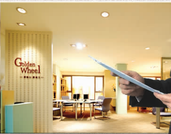
五星品质办公准现房,市中心的珍罕办公区