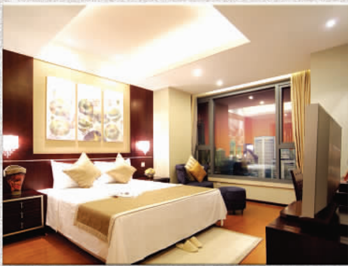
酒店式商务准现房,CEO的私人行宫