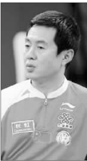
施之皓:我还能再干四年