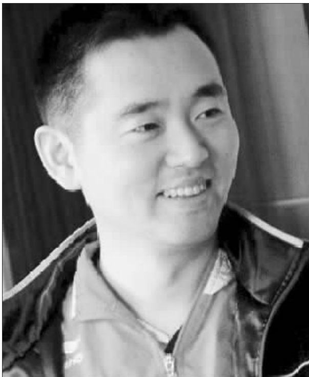
孔令辉:以后有的是机会 资料图片

北京时间昨天上午,国家体育总局乒羽中心在北京召开新闻发布会,宣布了上个月在张家港进行的国家乒乓球队教练竞聘会的结果,刘国梁和施之皓双双在竞聘中胜出,继续担任中国乒乓球队男女队的主教练。至于此前一直被认为是女队主教练热门人选的孔令辉则由于选票明显少于施之皓而最终落选。