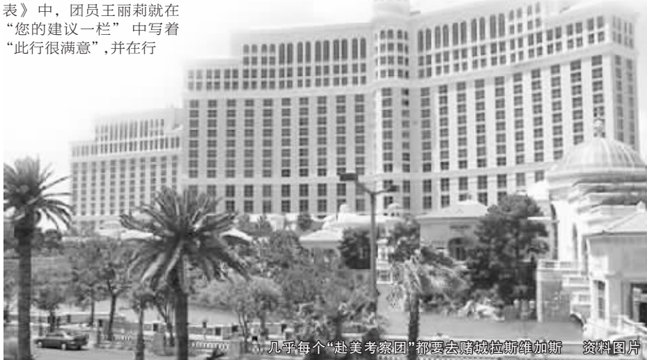
几乎每个“赴美考察团”都要去赌城拉斯维加斯 资料图片