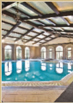
本版图片均为项目实景