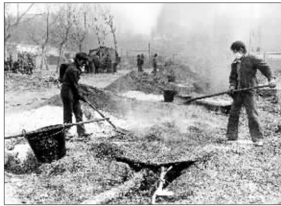
这就是所谓的“糖炒栗子”法 (资料照片)