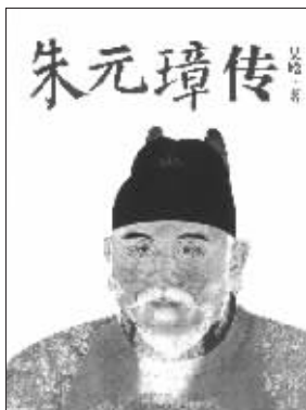
吴晗 著 陕西师范大学出版社友情推荐

吴晗写作的这本帝王传记,始作于60多年前,受到毛泽东的亲自过问与提奖,是帝王传记的巅峰之作。