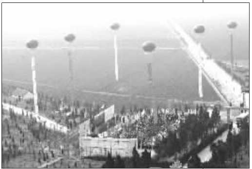
“标志城”未开工就热闹得像个大工地。