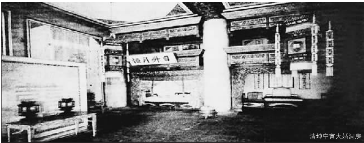
清坤宁宫大婚洞房

生活中,我们常常把某人对他人谄媚奉承的行为称为“拍马屁”。关于“拍马屁”的来历,还真有几种有趣的说法,都与蒙古人的习俗有关。一是说蒙古人有个习惯,当两人牵马相遇时,应该在对方的屁股上轻拍一下,以示尊敬。二是当蒙古人好骑手遇到难以驯服的烈性马时,就会拍拍马的屁股,这样会使马感到舒服,骑手即可乘机跃身上马。三是蒙古人爱马,如果马肥壮结实,两股必然隆起,所以见到骏马,蒙古人总喜欢拍着马屁股称赞一番。由此可见,这个词本来并无贬义。然而,这些礼节和习俗成了趋炎附势者谄媚奉承的方式。当他们看到权贵策马而来时,不管其马优劣如何,都会争着拍马屁股恭