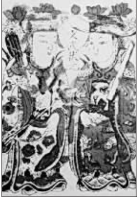
清:北京年画《文武状元》

这“青庐”是什么呢?就是为举行婚礼而临时搭建的帐篷,也叫“百子帐”。唐段成式在《酉阳杂俎》中解释说:“北朝婚礼,青布幔为屋,在门内外,谓之青庐。新婚夫妇一般在青庐交拜,《玉台新咏·古诗为焦仲卿妻作》(《孔雀东南飞》)中就有句子说:‘其日牛马嘶,新妇入青庐。’”如此看来,汉末以来,古人一般将青庐作为婚房的名称,因此后世也用青庐来指代结婚。直到唐代以后,洞房才取而代之,成为新的婚房代名词,青庐之称于是渐渐被人遗忘了。