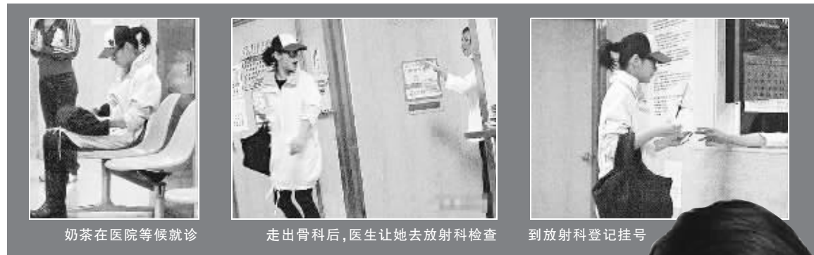
奶茶在医院等候就诊