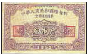
全国通用粮票

国以民为本,民以食为天。今天,中国的老百姓感受最深的莫过于自家餐桌的变化。无论你身在都市,还是居住乡间,每天的一日三餐都能令你品味出:生活正在变得越来越美好。