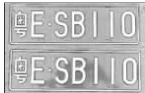
网友自称申请到的牌照

此帖一出,立即引来无数网友跟帖,到昨日下午,已经跟了21页。大多数网友表示楼主很强悍,还有人表示支持楼主,“这个号码比粤E74110还厉