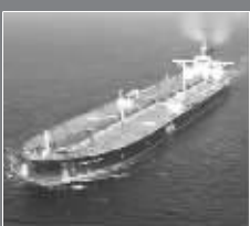
“天狼星”号超级油轮

继沙特阿拉伯“天狼星”号超级油轮15日遭劫后,索马里海盗继续疯狂作案,又劫持了一艘泰国渔船、一艘伊朗货船和一艘希腊散货船。英国媒体报道称,“天狼星”号已在索马里中部海域抛锚,并且海盗已提出1000万美元的赎金要求。北约和美国决定继续密切监视,暂时不使用武力夺回油轮控制权。