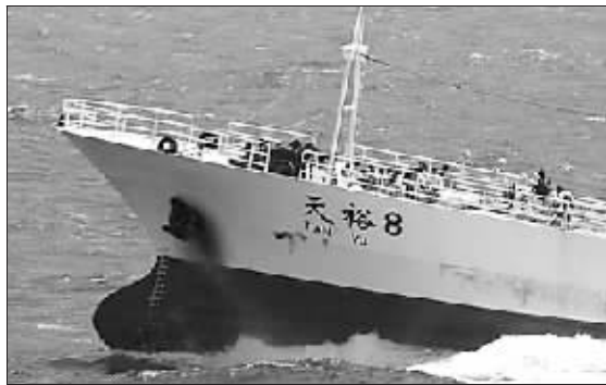
美海军公布的被劫“天裕8号”照片

据美国媒体报道,美国海军最新公布了14日遭索马里海盗劫持的中国渔船“天裕8号”的照片,中国船员在武装人员的枪口之下,围坐在一起。中国天津渔船“天裕8号”上包括16名中国船员在内共24人被海盗扣为人质。