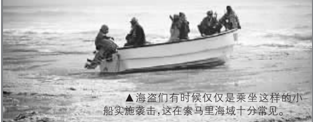
▲海盗们有时候仅仅是乘坐这样的小船实施袭击,这在索马里海域十分常见。