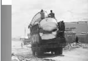
▲海盗们的卡车运输车队,每辆卡车上都载有5艘快艇。

两艘快艇一艘遭海盗遗弃,另外一艘落荒而逃。“塔巴”号本月2日开始在亚丁湾打击海盗以来,已经第三次成功挫败海盗劫船企图。