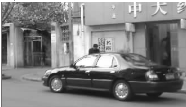
女车主所驾驶的尼桑轿车