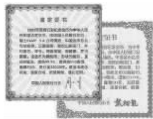
▲央行两任行长亲笔签名鉴定证书

金币由人民银行、金币总公司发行,中国文物学会监制,北京灵光寺开光。每套均有统一编号,央行鉴定证书和央行行长签名,开光证书,全国限量发行3300套,每套16800元。南京发行地址:龙蟠中路28号军区长城书店一楼 无锡发行地址:龙蟠中路28号军区长城书店一楼 南京发行电话:025-51730021 86083988 无锡发行电话:0510-89896113