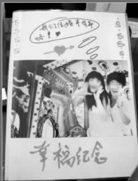
▲记者本中小王与小婷的合影