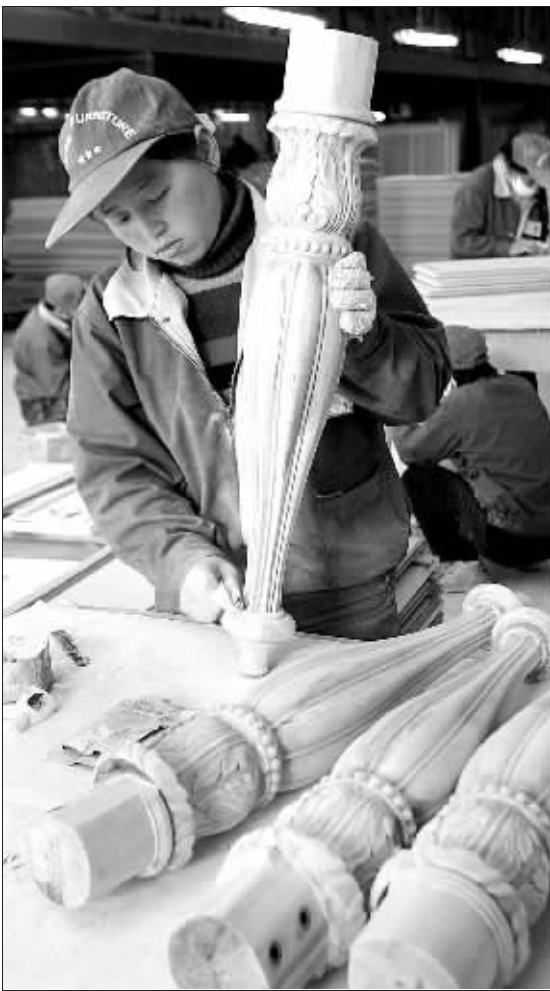
工人正在制作家具 (资料图片)