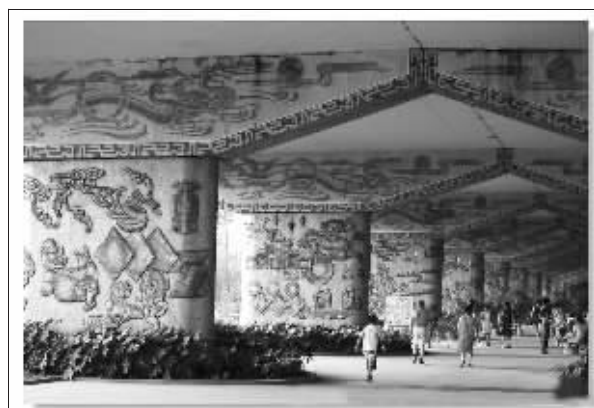
最牛桥墩看上去富丽堂皇

据有知情网友透露,这座“史上最牛的桥墩”来自四川德阳市鼓楼下的成绵高速高架桥桥墩。横亘在鼓楼与广场之间的高速公路桥墩,成了设计者发挥想象的地方。设计者将28个桥墩进行装饰改造,以仿古浮雕铜板扣画和仿敲银浮雕扣版画及大型仿烙铁装饰画体现德阳6县(市、区)历史文化、风景名胜、人文景观及重装基地风采。整个壁画长廊立体感极强,既抽象又写实,色彩明朗,极具现代艺术风格。彩虹桥、石刻、白马关、庞统墓、仓山大乐、黄继光纪念馆、三星堆、年画馆、剑南春……德阳的标志一一在此得以展现,每个篇章把历史文化、风景名胜、人文景观融为一体,形成一个完整的壁画群落,壁画面积达2309平方米,是整个德阳地区景点的微缩。“史上最牛的桥墩”于2007年初推出,并受到当地领导的表扬。