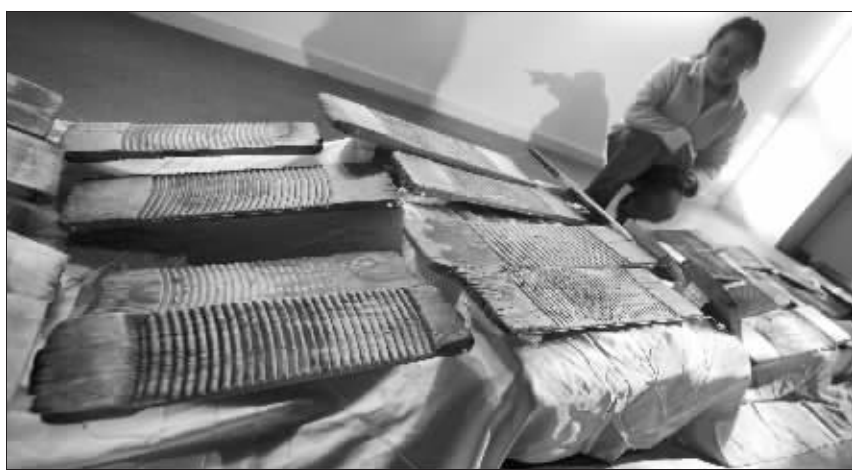
昨天,在南京凤凰美术馆举办的一场艺术展上,一件用56块磨损不一,属于不同主人的搓衣板组成的一幅名为《女人河》的装置作品格外引人注目,每一块搓衣板都在诉说着女主人们的经历和情感。