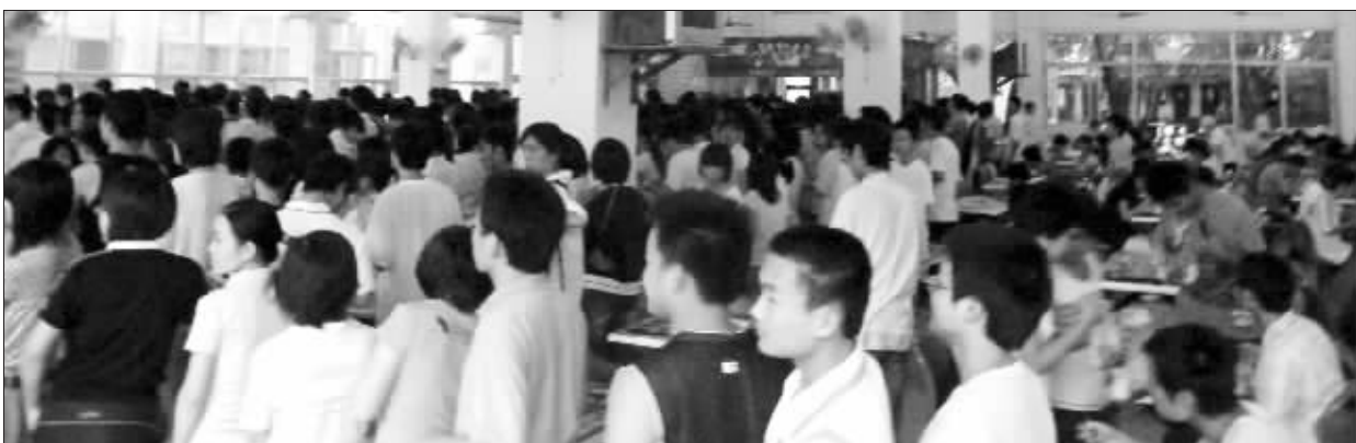
海南大学重新开放,学校食堂恢复正常营业