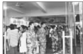
身着迷彩服的学生维持食堂秩序

从昨天开始就没有纯净水了,自来水中弥漫的都是消毒水的味道。没有烧水棒的人不知道今天怎么吃泡面。