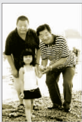
臧天朔与父亲及女儿在一起,这样美好的场面以后会不会成为回忆?