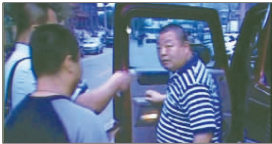
徐滔博客上传了一张疑似臧天朔被抓捕的照片

臧天朔是怎样被捕的?昨天,有目击人出来回忆现场经过,北京电视台《法制进行时》节目主持人徐滔也在博客发表了一篇题为《涉嫌聚众斗殴 歌手臧天朔被拘》的文章。他们的说法和北京警方的官方说法合在一起,还原了一个真实的捉捕现场。