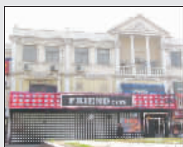
臧天朔开在廊坊市的“朋友”迪吧外观