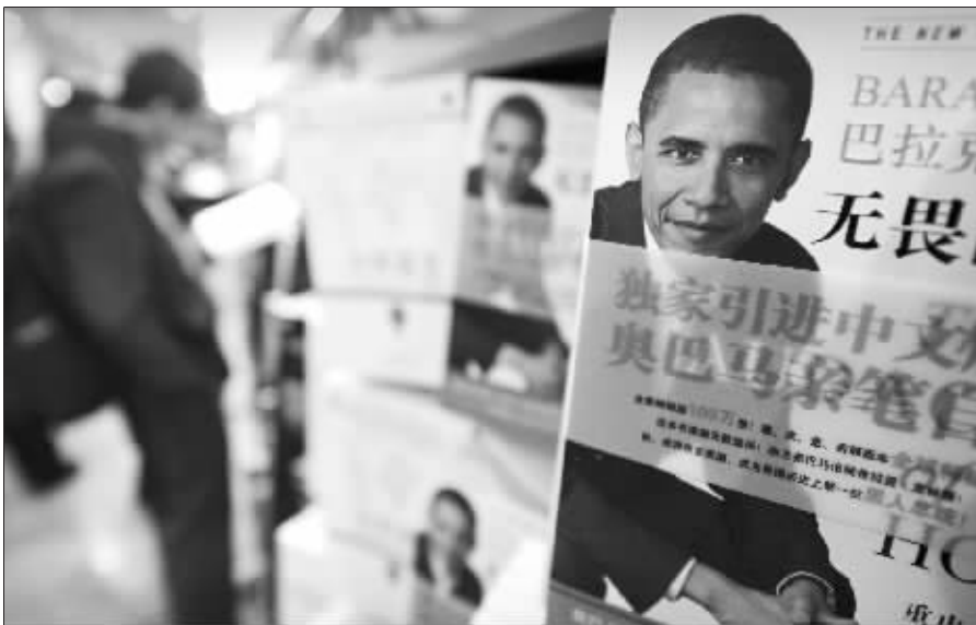
奥巴马书籍发售现场

北京时间11月5日中午,美国人巴拉克·奥巴马赢得了下一任总统选举的胜利,奥巴马创造了奇迹,成为了美国历史上首位黑人总统。奥巴马诠释的“美国梦”使很多人产生了解奥巴马的渴望。在美国大选中,奥巴马VS麦凯恩,这位黑人大获全胜,而在中国的“书市”上,奥巴马PK麦凯恩,黑人总统又独领风骚!奥巴马不光得了总统,他的传记也成为时下最“时尚”的读物。在11月5日中午奥巴马当选新任美国总统的消息传来后,南京新街口新华书店在半天时间内就销售有关奥巴马传记百余册,创下名人传记类图书日零售量的新纪录。