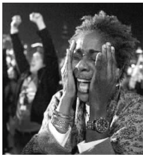
11月4日,奥巴马的支持者喜极而泣