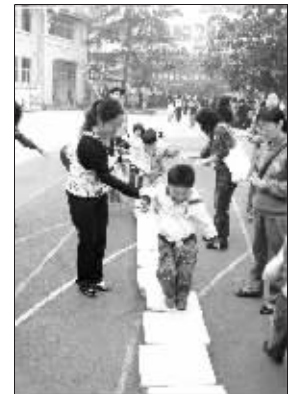
小朋友在玩“平衡小桥”