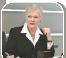
邦德的女上司M像个大妈一样唠叨但总帮助邦德。