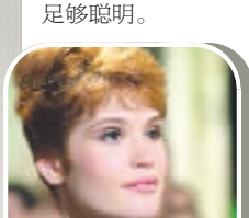
二号邦女郎菲尔蒙戏份虽少,但与邦德有一段激情感戏。