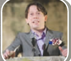
多米尼克·格林尼头号反派人物,举止优雅但一肚子坏水。