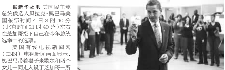
奥巴马投票后出示回执

据新华社电 美国民主党总统候选人贝拉克·奥巴马美国东部时间4日8时40分(北京时间21时40分)左右在芝加哥投下自己在今年总统选举中的选票。