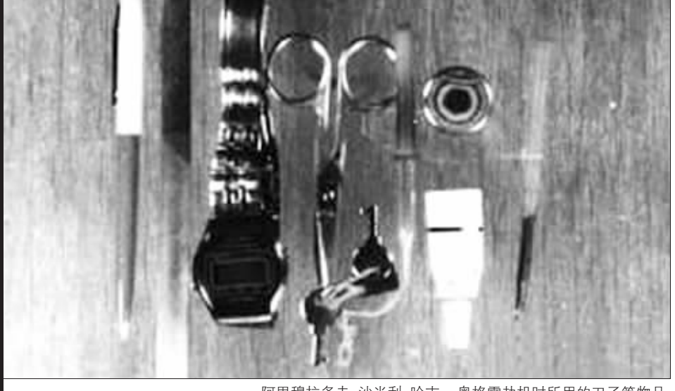
阿里穆拉多夫·沙米利·哈吉-奥格雷劫机时所用的刀子等物品

中期,中苏关系仍处在“僵持”之中。虽然由我国黑龙江省率先启动,两国边境地区传统的“以货易货”贸易稍有萌动,但上层除礼节性外,基本上还是“老死不相往来”。