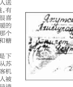
阿里穆拉多夫·沙米利·哈吉-奥格雷随身携带的物品