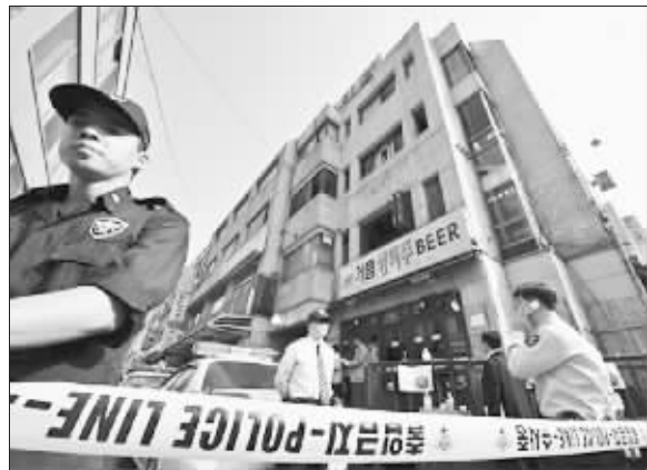
警察在旅馆外拉起了警戒线,火灾发生在楼房的第三层。据称,居住廉价旅馆的很多中国人都是在周边市场和饭店里的打工者。