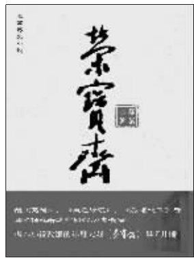
都梁 著 长江文艺出版社友情推荐