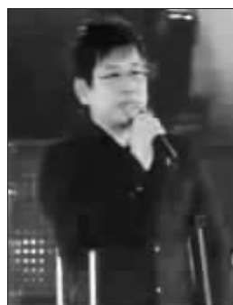
郑智化拄拐杖演唱

近日,央视金牌文艺节目《同一首歌》走进丽水市。演出明星有刘欢、孙俪、周华健、梁静茹、郑智化、韦唯、童安格等。但是,这场节目里面的一些细节,在全国一些论坛上引来了争议。有网友发了一篇《“同一首歌”让郑智化“罚站”》的帖子,称当残疾歌手郑智化拄着拐杖上台准备演唱时,主持人周涛却在台下和观众互动,“就这样折腾了十几分钟”,患着重感冒的郑智化才开始唱歌。等到结束时,他已经在台上拄着拐杖,站了半个小时。