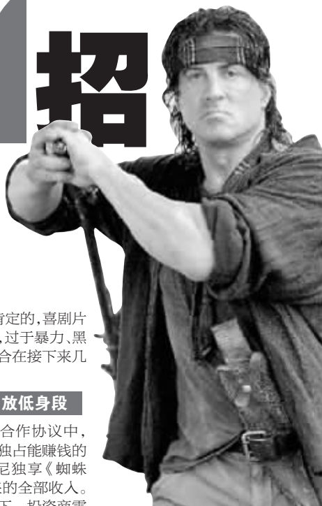
史泰龙放下身段去宝莱坞捞片