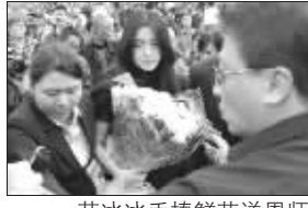
范冰冰手捧鲜花送恩师