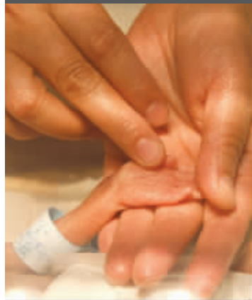
住院时,她的手臂只有大人手指粗