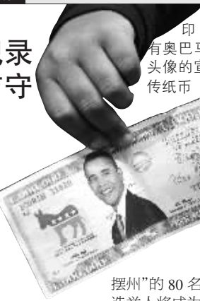
摆州”的80名选举人将成为两人争夺的重点。

美联社一项分析说,奥巴马已经在将产生264名选举人票的州内取得优势,与获取全国半数选举人票即270张选举人票仅一步之遥。而在麦凯恩明确优势的州内将产生185名选举人,另有6个“摆