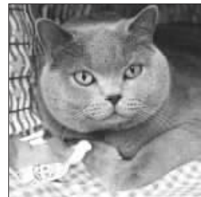
这只英国短毛猫是麦凯恩的候选代言猫。