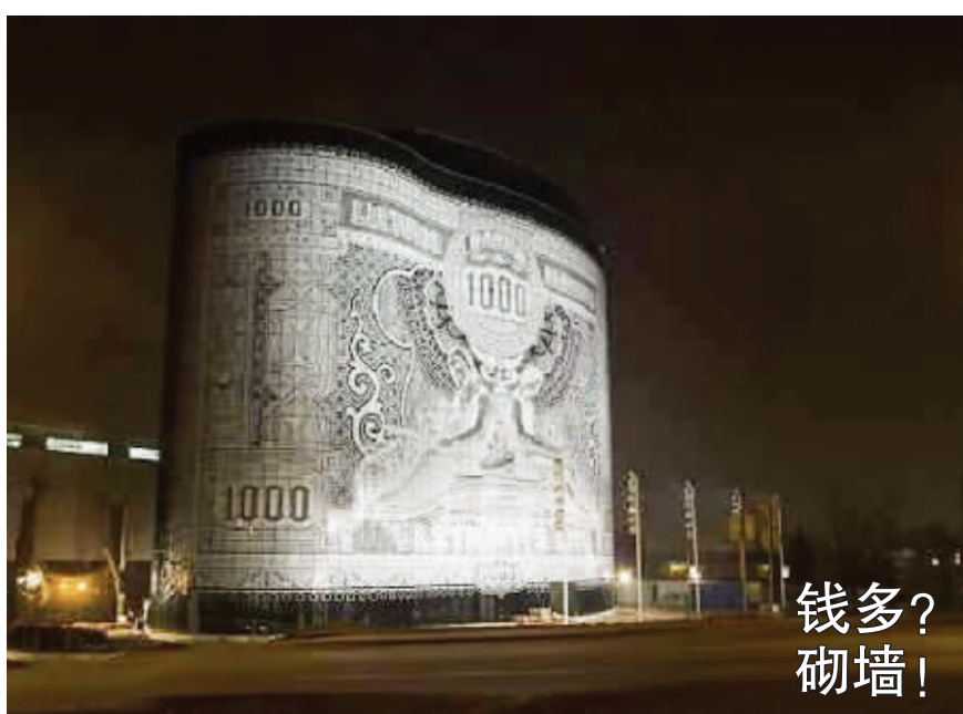
立陶宛有一幢“用钱造”的大楼,建筑师使用特殊材料在大楼的外部构造出了一张面值1000块的纸币

“梦露私生子”浮出水面之后,有许多人对此提出质疑。质疑者指出,约翰称他是梦露于1955年生下的,但这几乎不可能发生。因为那一年梦露刚拍完电影《七年之痒》,前往纽约开始和新情人、剧作家阿瑟·米勒约会,并在1956年与之结婚,这期间她完全没有和肯尼迪联系过。更为重要的是,由于当年梦露家喻户晓,她很难做到怀孕或者流产而不被人察觉,更何况生子这样的大事了。 旺旺