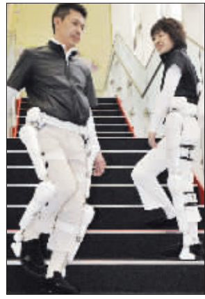
穿上“大力服”,力量瞬间增加十倍。

“大力服”技术还有望在工业和军事领域发挥更广泛的用途。 董倩妮(新华社供本报特稿)