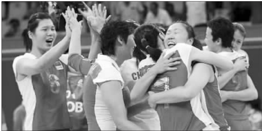
成绩好了,身价自然上涨

排拍广告或者进行商业活动的厂家几乎把排管中心的门槛都提高了。为了回避过多的商业活动,排管中心把广告费的门槛提高到100万元。即便如此,雅典奥运会后,还是有37家企业紧追不舍,经过挑选,排管中心只和其中的几家签订了广告合同。中国女排集体代言的东南汽车,广告费创下了近几年之最,4年高达350万元。另外,雅典奥运会后,女排的装备赞助商也变成了阿迪达斯,他们一年的赞助费是250万,是原来赞助费的5倍。