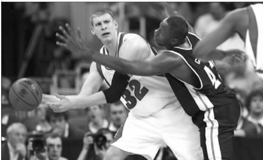
图为南钢看中的布莱恩(左)在NCAA比赛时照片