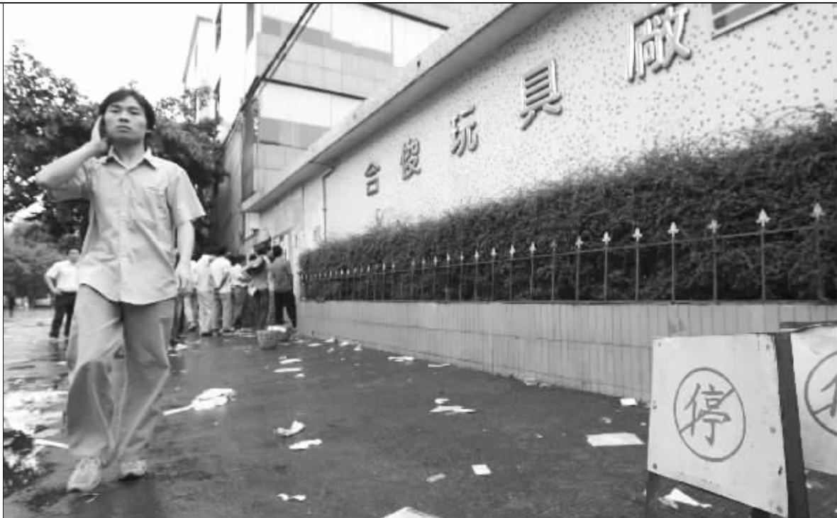
金融海啸对中国实体经济的危害逐渐显露。10月15日,全球最大玩具代工之一——合俊集团旗下两工厂倒闭

投资移民的人,已经率先感受到了风暴带来的阵阵寒意。金融风暴似乎还没有刮到大多数普通市民的身上,但是,股市投资者、外贸行业职员、房地产从业人员和想